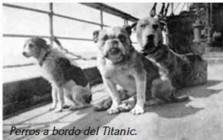
Perros a bordo del Titanic.